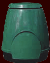
composter da 300 lt per l'agro

Usa il sacco compostabile ben chiuso, mettilo nell'apposita pattumiera marrone da 25 lt. nei centri abitati, nel bidone marrone nei condomini, e nel composter da 300 lt per l'agro.