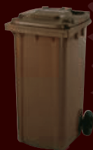
contenitore marrone 240 lt per condomini